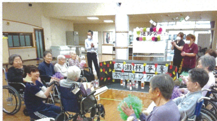
Aユニット・Bユニット・デイサービスのグループ戦で腕を競いました。