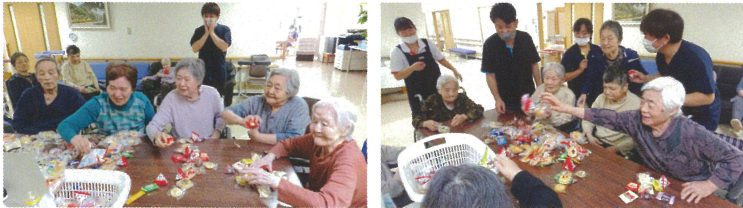
制限時間内にかごに玉を入れていきます。最後はかごに入れた分のお菓子がもらえるため、より一層真剣に！