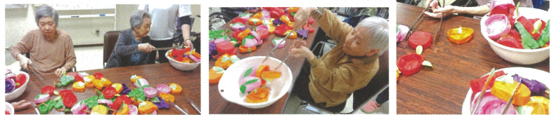
りんご・桃・ぶどうなど色とりどりの果物を収穫していきます。