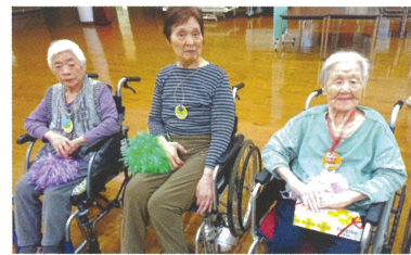
見事優勝したデイサービスの皆さんには、施設長より商品のアイスクリームが贈呈されました。