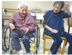
釣り竿から魚を外す職員が大慌てなほどの大漁！