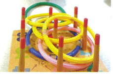
高得点に狙いを定めて力いっぱい投げます！