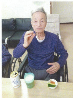
ビールの相性もバッチリ