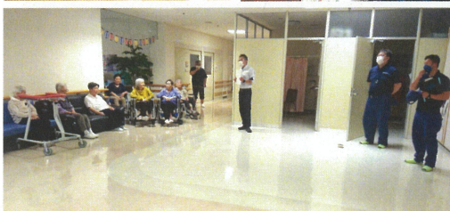
苑内で日中に火災が起きたことを想定し、 それぞれ一番近くの非常口に避難しました