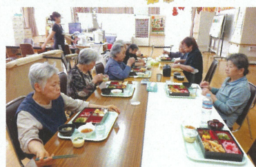
長寿を祝い、これからも毎日元気に過ごせるように願いました