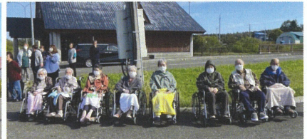
長い歴史を誇る鬼志別小学校鼓笛隊の最後の演奏を鑑賞しに、プチおでかけ♪ お天気にも恵まれ心地よい気温のなか、素敵な音色を楽しみました