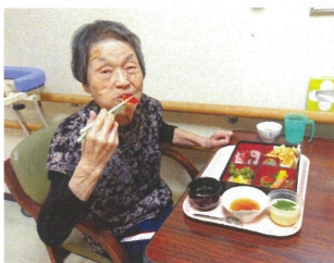
厨房職員が心を込めて、祝い膳をご用意しました