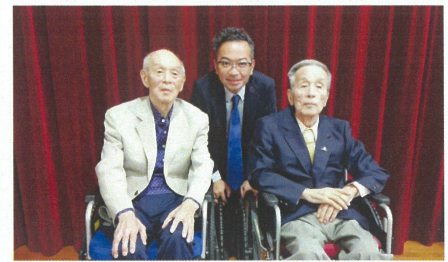
ネクタイを締め、華やかな装いで 猿払村敬老会に参加しました