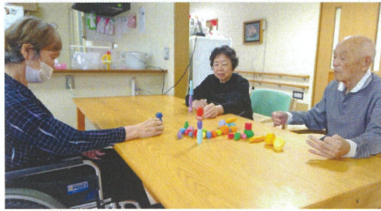
カラフルなウッドブロックを 彩りも考えながら高く積み上げます…