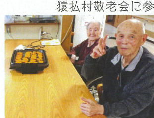
かぼちゃ団子は、焼いている間も 甘くて香ばしい香りが漂っていました