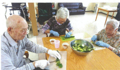
やすらぎ苑の菜園で育ったきゅうりを収穫！ みんなで浅漬けや、もろきゅうにして夏の恵みを堪能しました